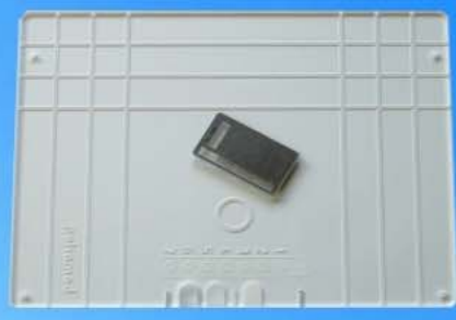
Strukturplatte digitale Mammographie