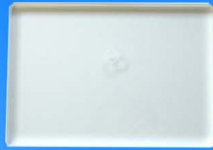
20mm Zusatzplatte in den Maßen

20mm thick additional plate with the dimensions